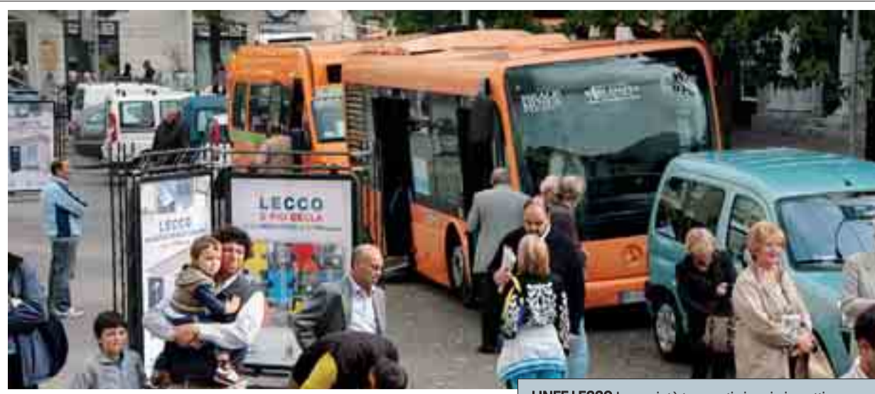
LINEE LECCO La società trasporti viaggia in cattive acque