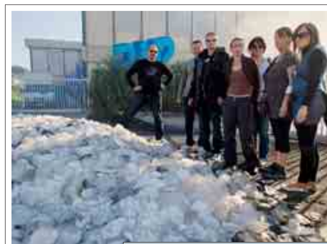
DA GETTARE Le protesi per il seno difettose