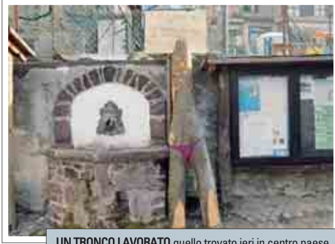
UN TRONCO LAVORATO quello trovato ieri in centro paese

Dal 7 all'11 febbraio si è svolto infatti un corso di secondo livello per ottenere il patentino per operatori per imprese boschive al quale hanno partecipato quattordici giovani di tut-